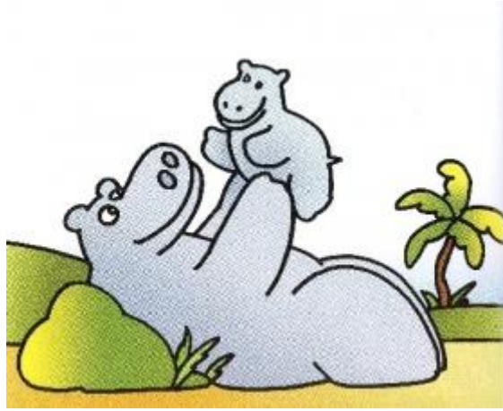
Mamma ippopotamo è una madre single

Il libro è stato pubblicato in Italia nel 2011 dall'autrice, Francesca Pardi, ed è illustrato da Francesco Tullio Altan, famoso anche come autore di vignette satiriche.